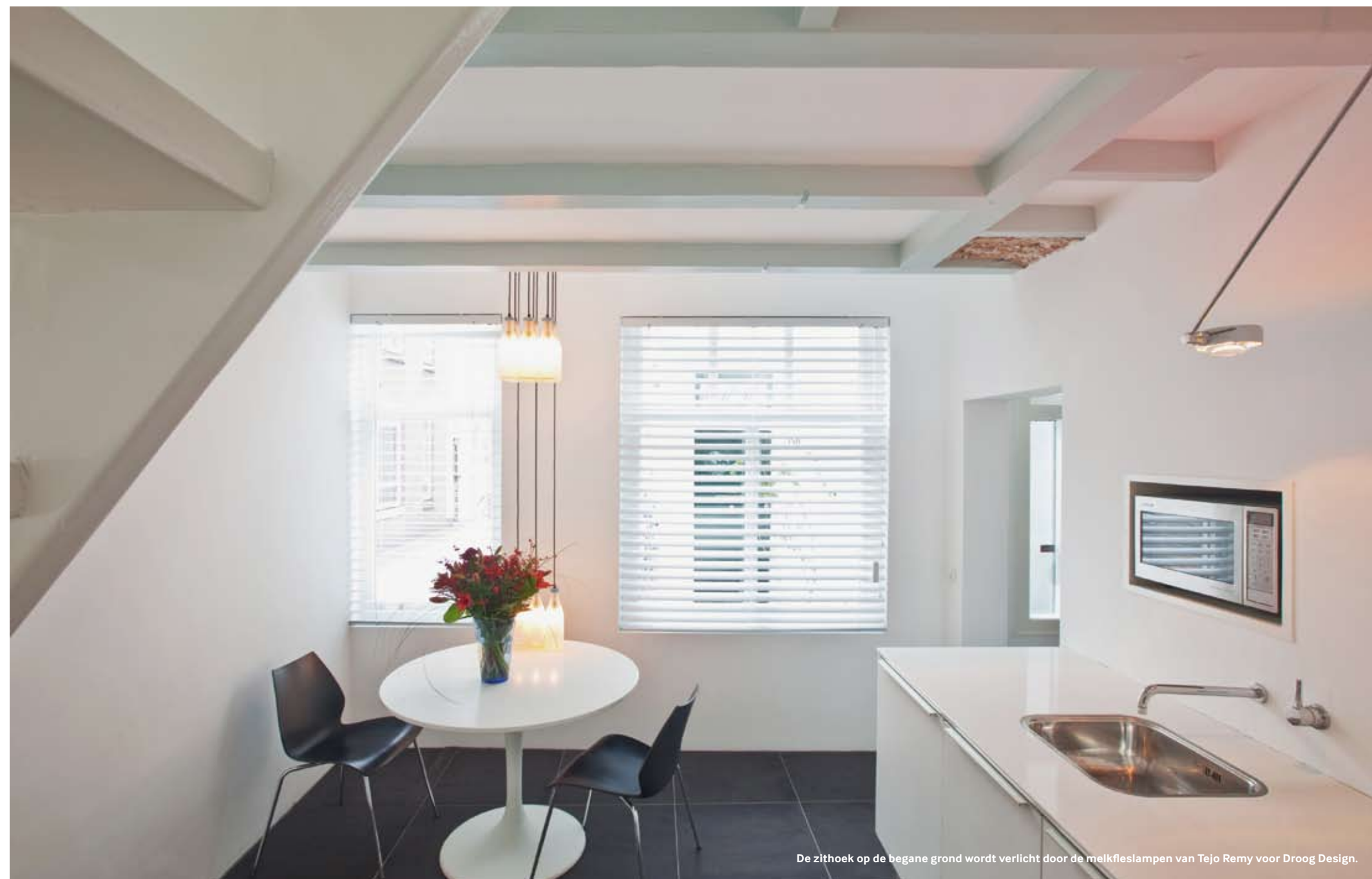
De zithoek op de begane grond wordt verlicht door de melkflessenlampen van Tejo Remy voor Droog Design.

In de relax- en slaapzone zijn de oorspronkelijke houten plankenvloeren behouden. Een enkel designmeubel en bijzondere designverlichting, zoals bijvoorbeeld de flessenlamp van Tejo Remy, maken het geheel af. Als raambekleding is gekozen voor brede horizontale lamellen die zorgen voor een sterke overgang tussen binnen en buiten en een eenduidig gevoelbeeld.